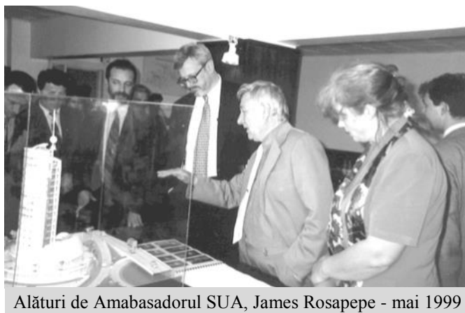
Alături de Ambasadorul SUA, James Rosapepe - mai 1999

Ca peste tot în lume, Maramureșul a beneficiat de o instituție care, după '89 a fost lipsită de implicare politică și a făcut din zona maramureșeană o regiune dezvoltată peste media unor zone cu potențial